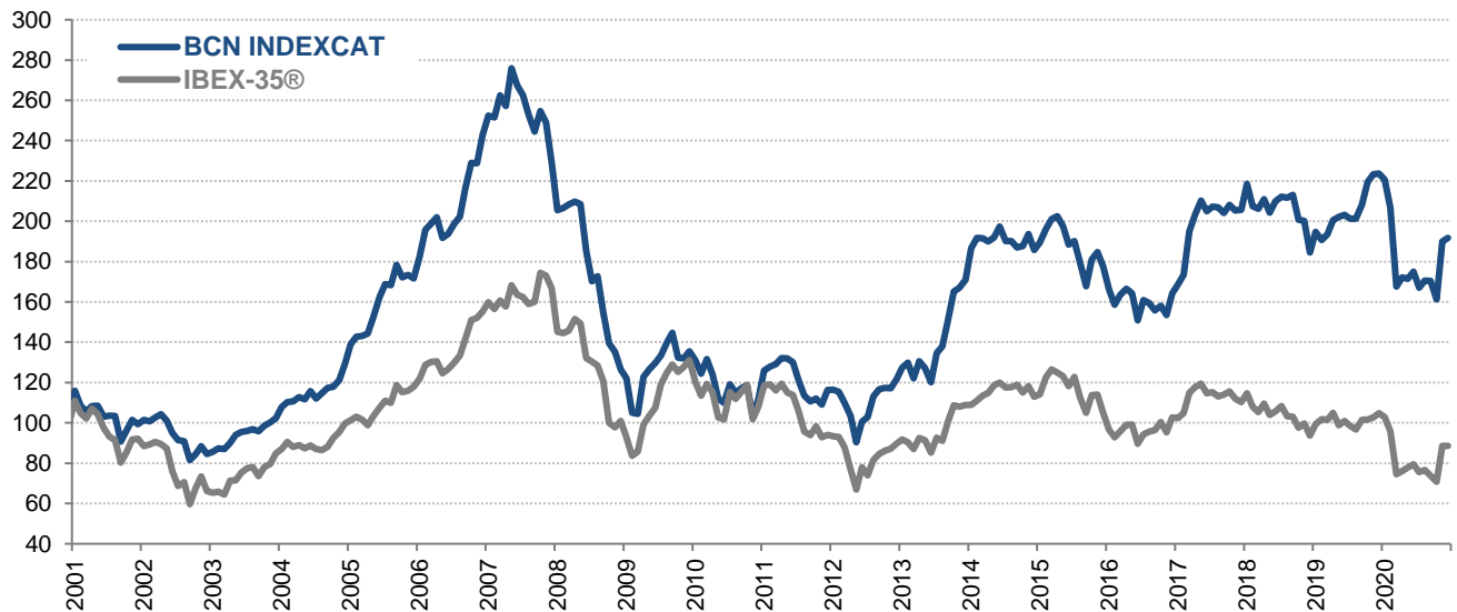
BCN INDEXCAT vs. IBEX-35® (Registros mensuales, Base 01/01/2001=100)